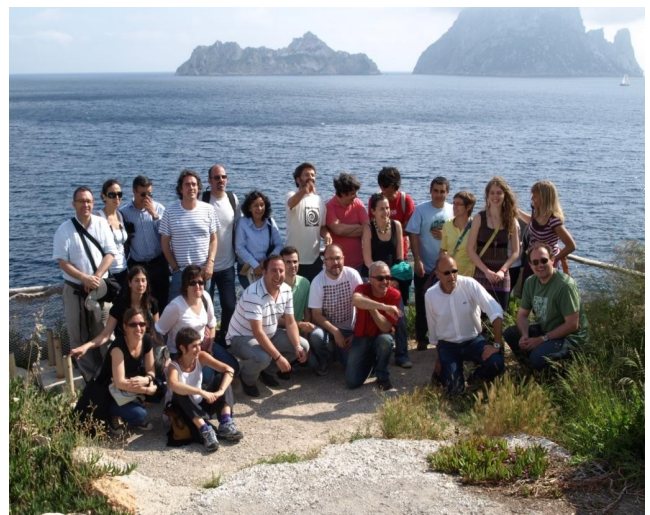
Salida técnica, frente al islote Es Vendrá (GIST, 2010)

El reto de integrar la investigación turística realizada por grupos localizados en áreas de destino en las principales corrientes de difusión de pensamiento a nivel internacional.