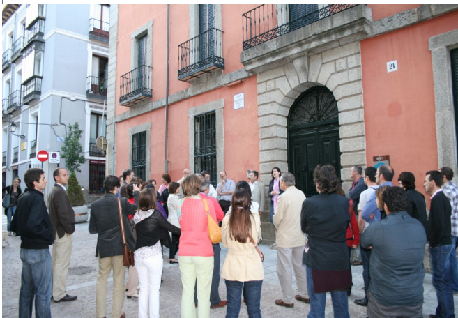
Salida Técnica en el Escorial II (Organización, 2010)

como vector de diversificación económica de áreas rurales) e incluso se tienden puentes hacia ramas de perfiles más específicos, caso de la geografía de los transportes (transportes y turismo) y la geografía cultural (representaciones culturales y turismo). No obstante, emergen antiguos y nuevos problemas que han de servir como retos a afrontar. Los niveles de internacionalización son reducidos, a pesar de la presencia de comunicantes de fuera de nuestras fronteras. Además parece existir cierto agotamiento temático, en tanto que se percibe un