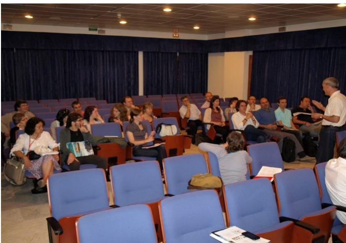
U. Illes Balears Sede en Ibiza (GIST, 2010)