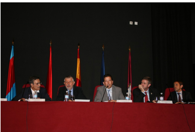
Inauguración del Congreso (Organización, 2010)