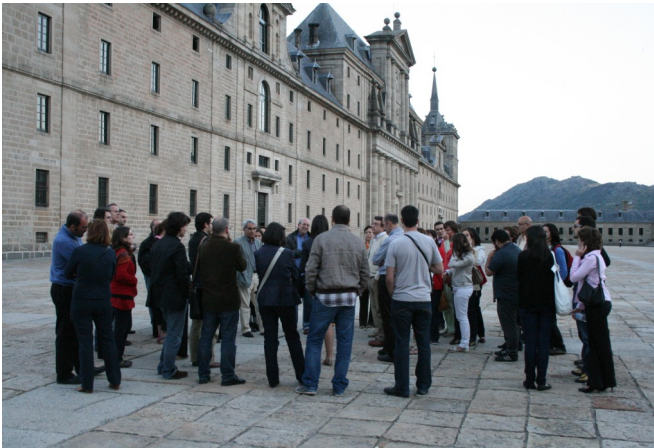
Salida Técnica en el Escorial I (Organización, 2010)